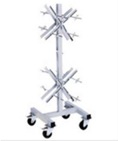
Chariot porte rouleaux de joint 1517 Possibilité de monter 4 bobines de joint Equipé de 4 roues mobiles dont 2 avec freins Hauteur : 1 500 mm